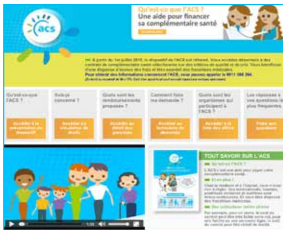
Site Internet www.info-acs.fr